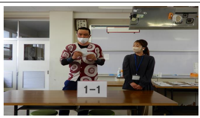
1 年 1 組から役員対象者抽選