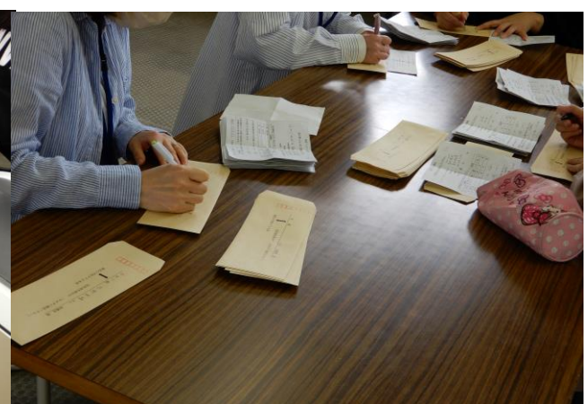
役員通知書宛名記入