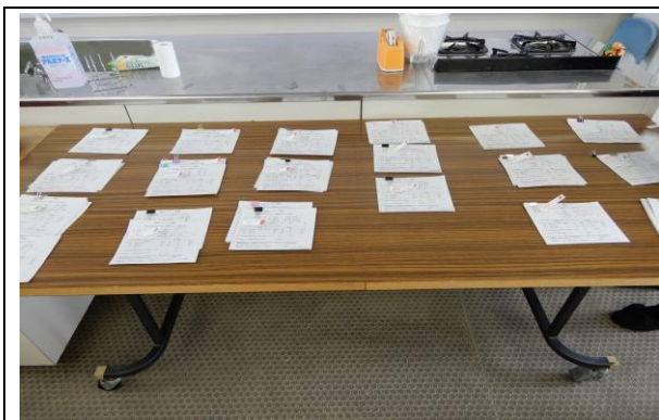
各クラス対象抽選者